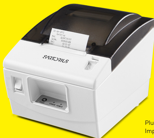
Plug & Play Impresora estándar YDP40